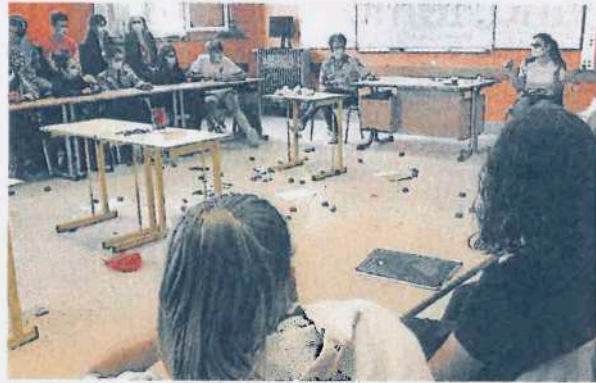
Des élèves de seconde assistent à une pièce de théâtre pour les sensibiliser au harcèlement scolaire.

« Face à une situation de harcèlement, comment réagiriez-vous ? »,