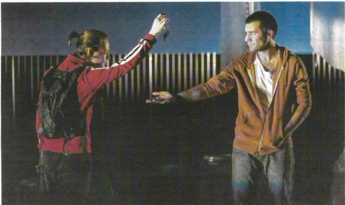
Ici, il est question, de façon claire et crue, de violence sociale, de racisme, de ségrégation urbaine, d'arrogance de l'argent, de frontières figées. Victor Tonelli/Hans Lucas

1986 QUAI OUEST EST CRÉÉE À NANTERRE DANS UNE MISE EN SCÈNE DE PATRICE CHÉREAU.